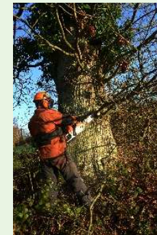
Coupe d'une haie avec matériel adapté